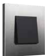
stainless steel on anthracite

Hou je van ultrastrak design in tijdloze materialen? Dan kies je voor de uitgepuurde schoonheid van Niko Pure. Een reeks gemaakt uit bijzondere materialen vol verhaal en emotie zoals bamboe, roestvrij staal, bakeliet en plexiglas. Jouw garantie voor een stijlvolle en duurzame afwerking. Betaalbaar topdesign.