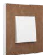
skin sensation cinnamon