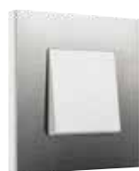
stainless steel on white