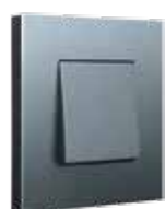
alu steel grey