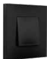
Bakelite® piano black