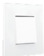
liquid snow white