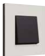
natural soft grey