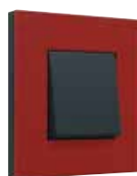
natural soft red