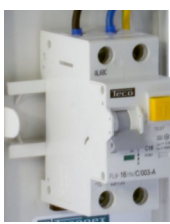
Differentieelautomaat 16A 30mA 10kA