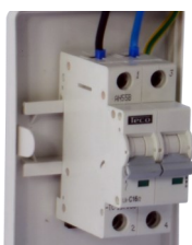
2-polige automaat 16A 10kA Curve C