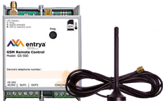
GSM module en antenne

Alle oproepen naar uw GS-500 zijn gratis want de module weigert alle oproepen. U kunt het toestel laten terugbellen om een actie te bevestigen. Gaat u veelvuldig gebruik maken van deze controlefunctie, dan raden wij aan om voor een abonnement te kiezen.