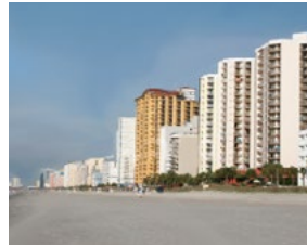
Toegang tot vakantiewoning