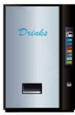
Ter vervanging van muntjes