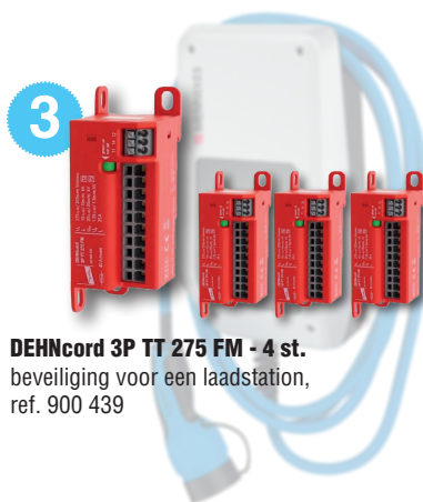
DEHncord 3P TT 275 FM - 4 st. beveiliging voor een laadstation, ref. 900 439