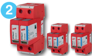
DEHNgard M TT 2P 275 - 3 st. Monofasige overspanningsbeveiliging Type 2, voor 1N230V net - ref. 952 110